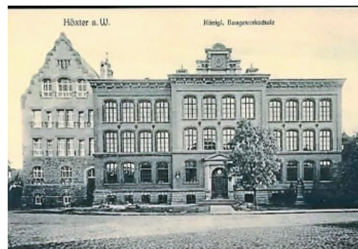
So sah sie aus, die alte Bauschule in der Innenstadt. Seit 1864 gibt es die Hochschullehre in Höxter.

Mitglied des Vereins kann jede natürliche Person, juris-