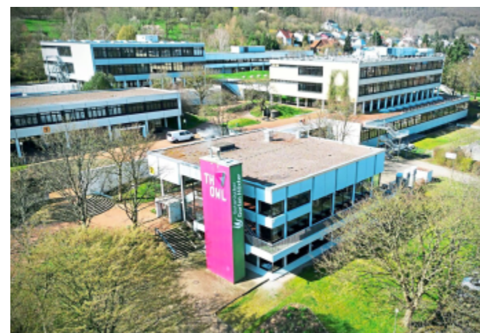
Der Hochschulstandort Höxter der Technischen Hochschule OWL (TH OWL) muss erhalten bleiben. Dafür setzen sich viele Menschen in Höxter und Umgebung engagiert ein. Die Hochschule wurde im Jahr 1971 gebaut.