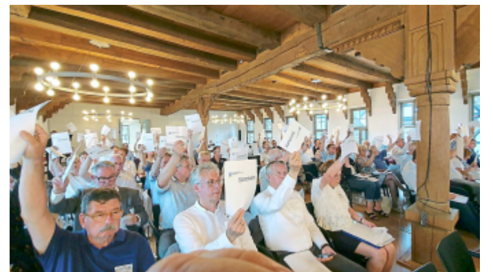
Einstimmig sind alle Punkte bei den Vorstandswahlen und bei den Satzungsfragen im Rathaussaal verabschiedet worden.

„Wir können nicht auf der einen Seite den Fachkräftemangel beklagen und gleichzeitig die Angebote so stark konsolidieren, dass sie von vornherein für nur wenige Menschen infrage kommen. Deshalb habe ich von Anfang an und wiederholt klargestellt: Der Hochschulstand-