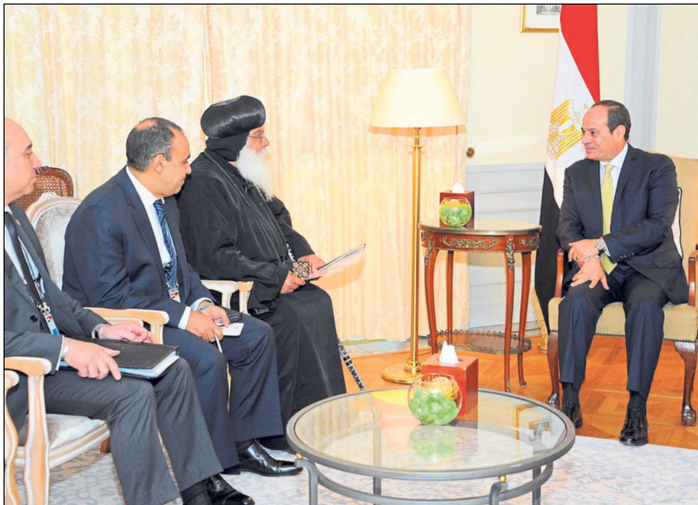
Der ägyptische Präsident Abd al-Fattah as-Sisi (rechts) hat Damian (3. von links) im Hotel »Adlon« empfangen; im Bild auch der Geheimdienstchef und der Außenminister.