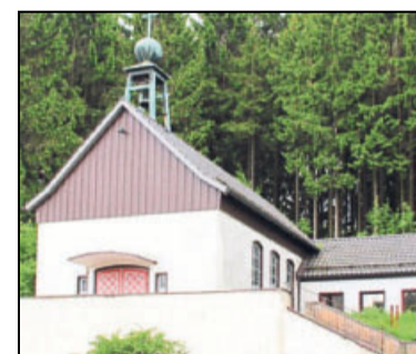
Die Kirche in Bad Grund von 1960 ist jetzt koptisch.