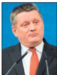
Besucher: Minister Hermann Gröhe.

100 Besucher aus ganz Deutschland werden vom 28. bis 30. Juli zu den 10. Tagen der Ägyptologie im Kloster erwartet. Namhafte Wissenschaftler halten Referate. In den Ferien sind wieder zahlreiche Reisende und Gäste im Kloster, so wie Patienten, die in Höxter oder anderswo operiert wurden und sich in Brenkhausen erholen.